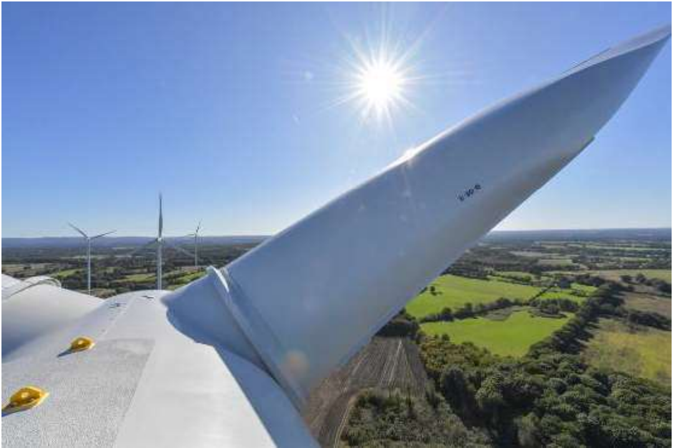
Parc de six éoliennes à Saint Martial sur Isop

165 associations se battent actuellement contre des éoliennes en Nouvelle-Aquitaine. Onze d'entre elles, au nom de toutes, ont décidé d'aller en justice. Dans leur viseur : le Sradet, un schéma régional qui prévoit une nette hausse du nombre d'éoliennes sur le territoire.