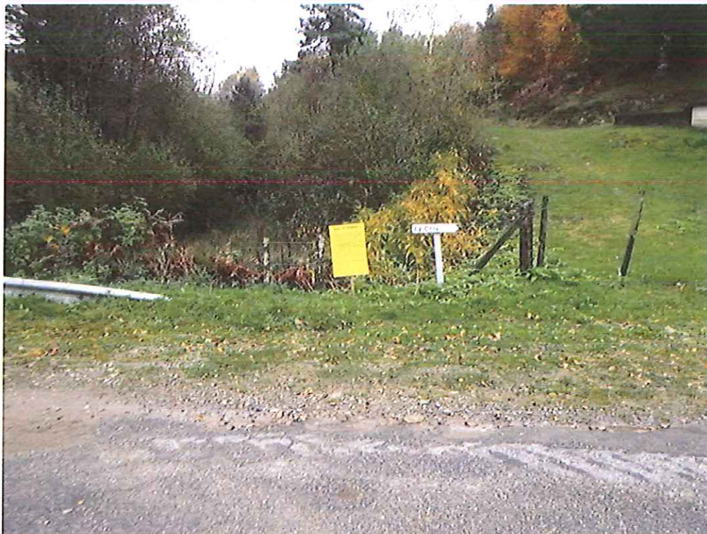
Affichage du panneau sur la voie publique près du lieu-dit la Côte sur la commune de Lestards