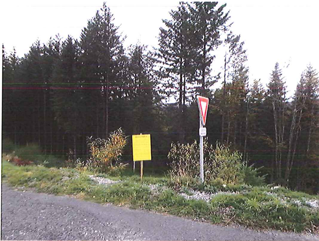
Affichage du panneau sur la voie publique près du lieu-dit Nespoux sur la commune de Treignac