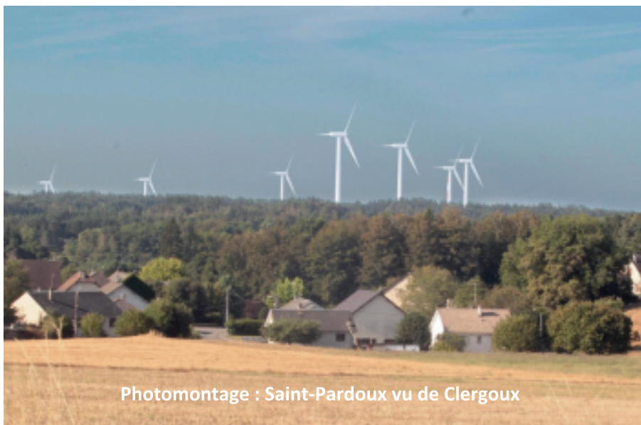
Photomontage : Saint-Pardoux vu de Clergoux